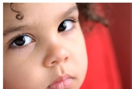
Met de opvang van een jong kind steunt u ook de ouder(s)