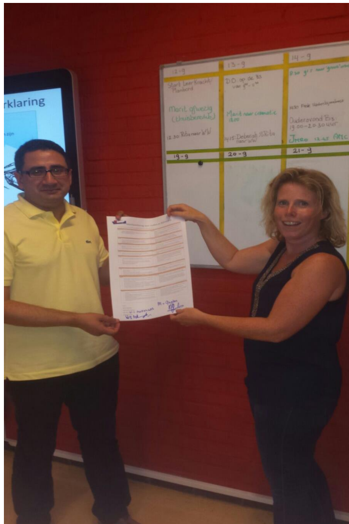
De eerste intentie verklaring werd op de ouderavond symbolisch ondertekend.

De ouders van groep 7 en 8 krijgen donderdagavond 22 september informatie over de kernprocedure (overstap PO-VO). De avond wordt aangeboden op Wereldwijs en start om 19:00 uur