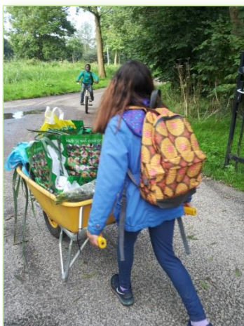
De wortel- en prei oogst was zoveel dat we met de kruitwagen terug naar school moesten!