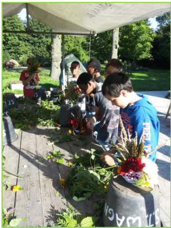
Met bloemen uit eigentuin hebben we bloemstukjes gemaakt.